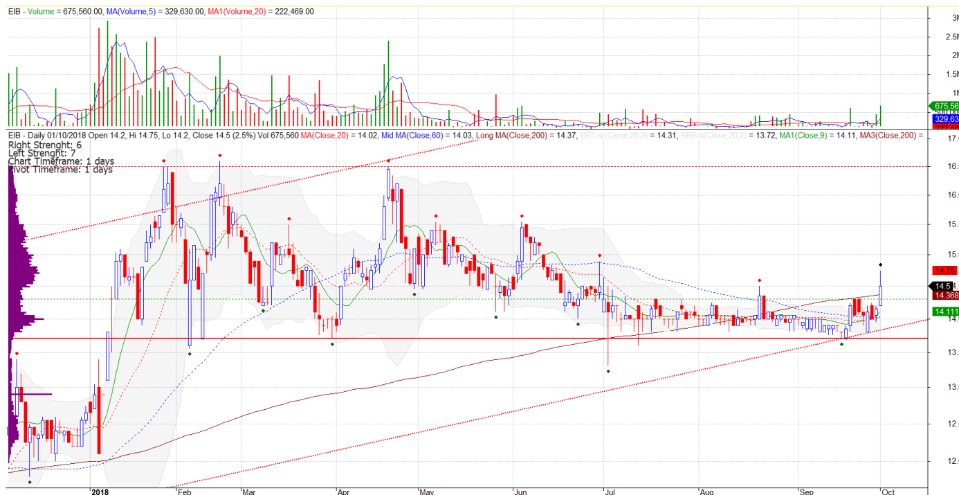
Chart 1 : Xu hướng ngắn hạn trên khung thời gian EOD